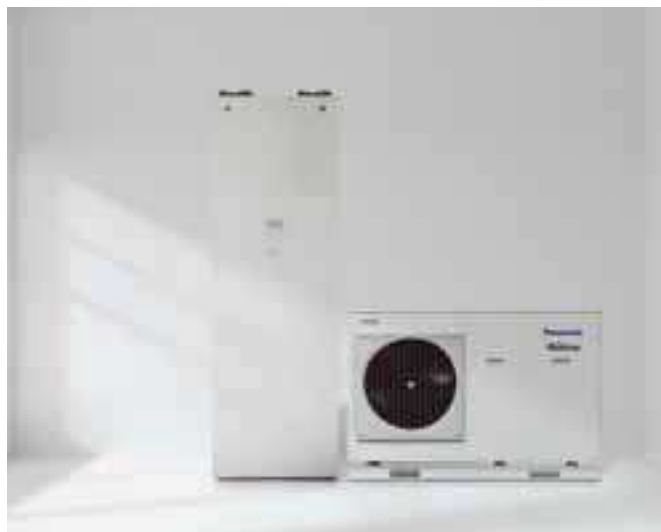
Jedná se o koncepční představu, může dojít ke změně bez předchozího oznámení.